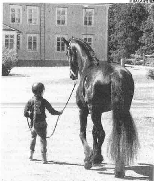
Crown-tamma Jebina on miellyttävä käsitellä. Jebina kuuluu friisiläisten parhaaseen 5 prosenttiin.